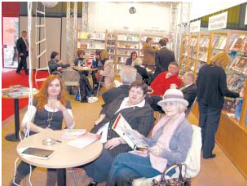
S hrvatskog štanda

Osim izložaba ilustratora iz cijeloga svijeta te predstavljajnja knjiga, u sklopu sajma, a i uoči njega, održani su različiti susreti s piscima i ilustratorima, seminari vezani uz dječju knjigu i obrazovanje te radionice. Počasni gost bila je Koreja. Hrvatski štand, koji se, kao i proteklih godina, protezao na 48 četvornih metara osmislili su Danijel Srdarev i Kašmir Huseinović, a ove je godine izgledao poput maloga svemira jer je 2009. proglašena godinom astronomije.